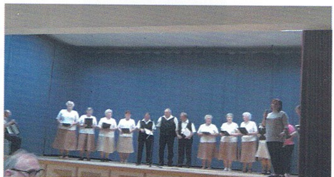
A Nyírcsaholyi Idősek Klubja

Felelős kiadó: Magyar Csabáné Főszerkesztő: Varjasi-Veréb Adrienn Szerkesztők: Sztalóczkyné Alexa Edina Bartkuné Angyal Ibolya Lektorálta: Főrizs Istvánné