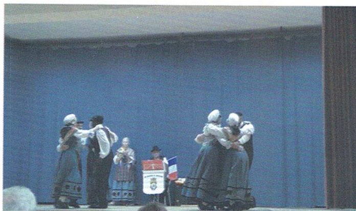
A Los CarcinolsDe Montalban francia táncsoport