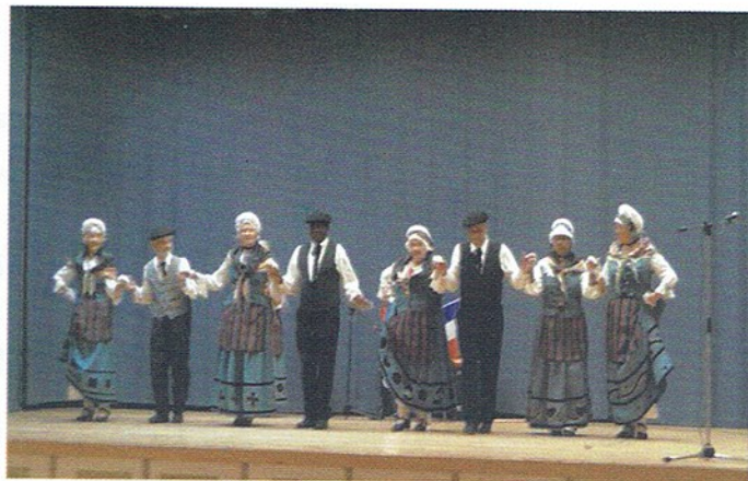
A Los Carcinols-De Montalban francia táncsoport