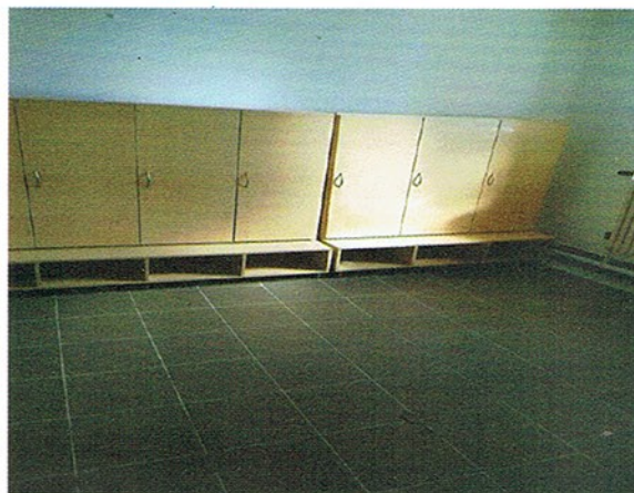
Képek az új óvodai helyszínekről