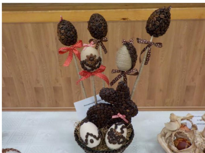
Babkávé figurák Húsvétikosár- kiállítás 2019. 04.11.