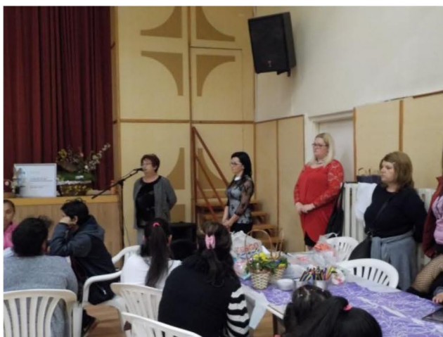
Április 9. Kooperatív családi nap a húsvét jegyében Megnyitó