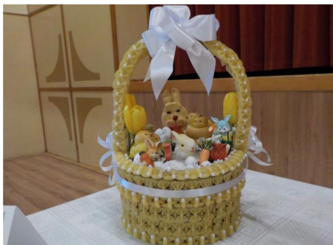
Tésztakosár Húsvétikosár - kiállítás 2019. 04.11.