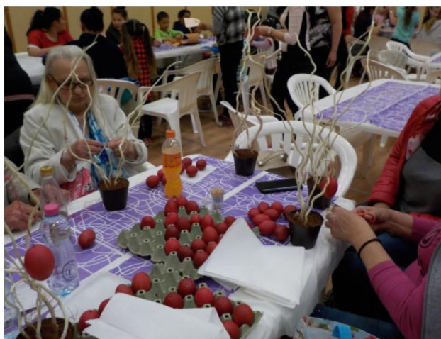
Április 9. Kooperatív családi nap a húsvét jegyében